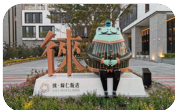
📍 臺南徠歸仁飯店 (臺南市歸仁區中山路三段 455 號)