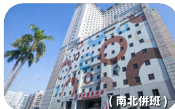
📍 臺中鳳凰酒店 (臺中市中國民權路 162 號)