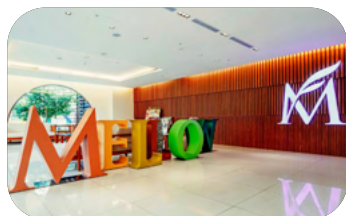
📍 臺北沃田旅店 (臺北市士林區中山北路七段 127 號)